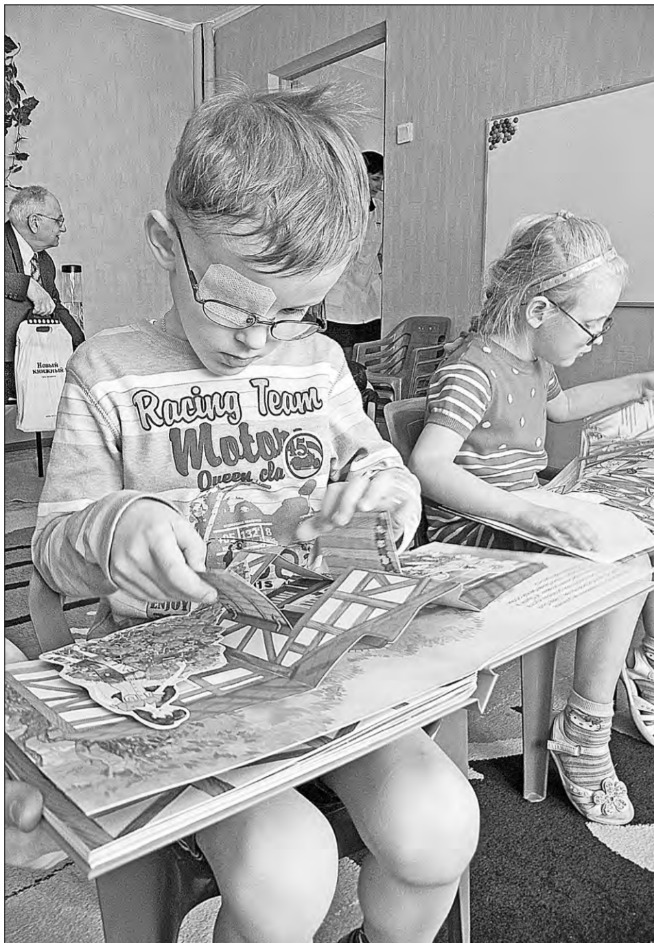
Начало на стр. 3