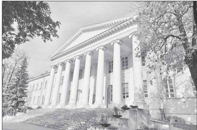
Больница на улице Достоевского.

Начало на 1-й стр. На Каретный ряд выходит торец главного фасада этого памятника архитектуры.