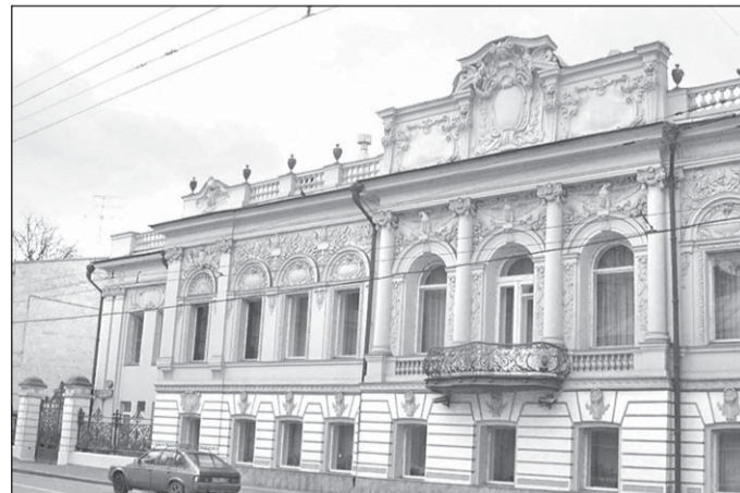
Пречистенка, 22. Дом Ермолова.

Много памятных мест, связанных с войной 1812 года, на улице Пречистенке. Например, дом 17. Эту усадьбу у генерала Бибиикова купил герой Отечественной войны 1812 года, поэт-партизан, а затем генерал-лейтенант Демис Давыдов. Тогда-то в доме бывали Пушкин, Баратынский, Языков, Дмитриев. Сегодня этот особняк в частном