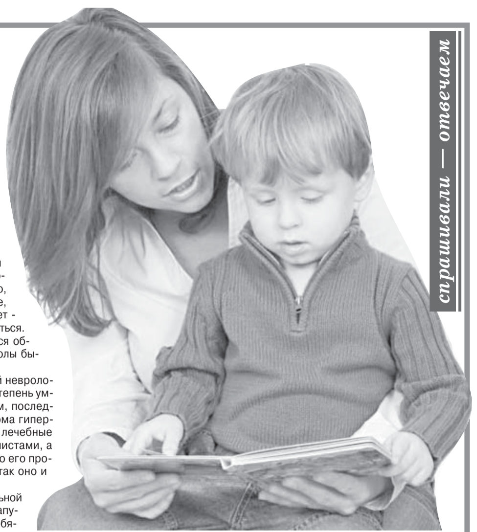
спрашивали — отвечаем

Следующая социальная (и отчасти эмоциональная) причина плохой успеваемости (в начальной школе она встречается относительно редко, далее ее удельный вес резко возрастает) - это конфликты ребенка с одноклассниками, неумение или нежелание строить с ними адекватные, дружеские отношения. Ребенок нелюдим или чрезмерно застенчив? Имеет какой-то недостаток внешности или слишком вспыльчив и агрессивен? Его дразнят или избегают, ему не дают проходу, у него нет друзей, он не хочет идти в школу, постоянно испытывает напряжение, переживает? В результате - страдает успеваемость.