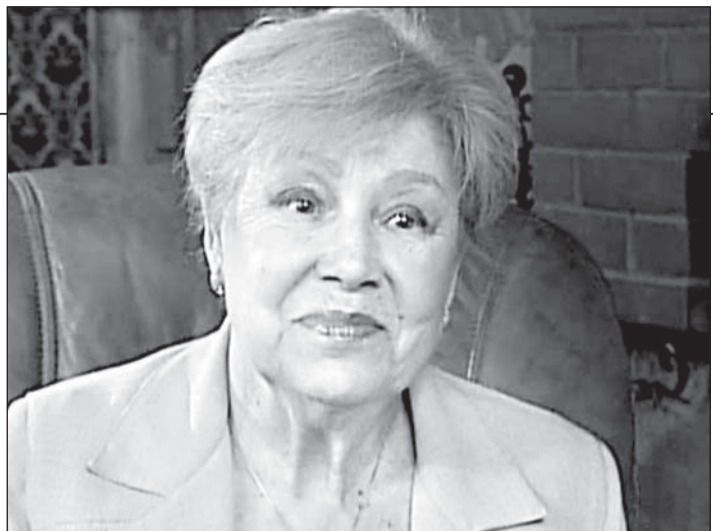
● ЛИЦА СТОЛИЦЫ