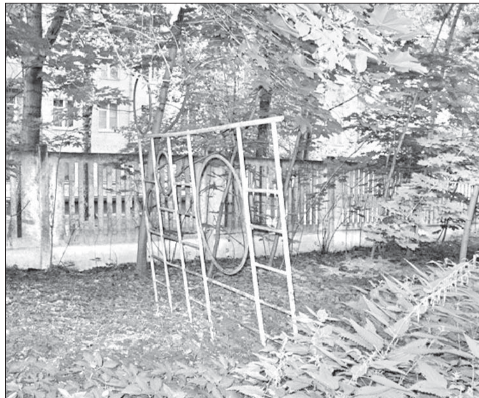
Игровая зона на территории заброшенного детского сада, Головинское шоссе, дом 6-а.

Однако Москва, по мнению Духаниной, «должна найти механизм, который