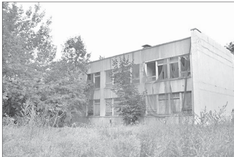
Здание детского сада, ул. Знаменская, дом 41.

Олеся ТОЛМАЧЕВА.