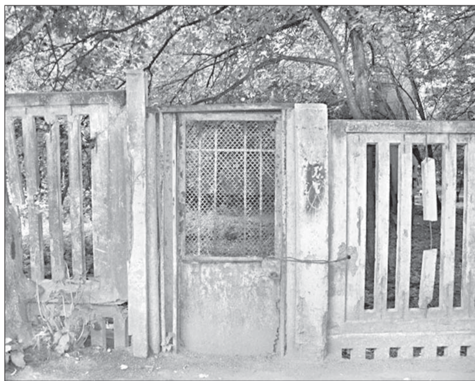
Калитка по тому же адресу.

ваны «посланиями» московской молодежи к трудовым мигрантам, окна выбиты, сквозь трещины асфальтированных дорожек, не знакомые с газонокосилками, прорастают мощные стебли сорняков.