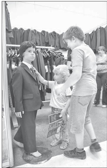
рой начинающий ученик считает своим долгом пролить его на школьную форму. Не отстирывается. Ничем. Так что лучше клеющий карандаш. Он, может, и не так хорошо приклеит цветную бумагу, зато не

Тетрадки стоит выбирать без излишней мультипликации, дабы школьник не отвлекался от арифметики созерцанием шреков, микки маусов и белоснежек. Обложки самих тетрадей и их защитная прозрачная упаковка должны быть плотными. Дешевенькие тетрадки традиционного зеленого цвета в руках неутомной ребятни очень быстро ветшают и отрываються от соединяющих скрепок. Клей - только не ПВА! И даже вопреки требованиям учителей. Каждый вто-