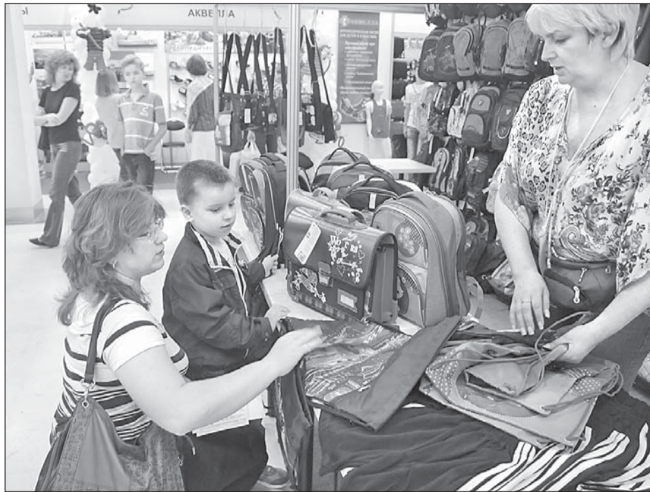
испортит некрасивыми пятнами аппликационный шедевр.

Обложки для учебников дети любят грызть. Причем увлекаются этим не только малыши, но и нервничающие перед контрольной старшеклассники. Не жадничайте: просто купите их побольше, про запас.